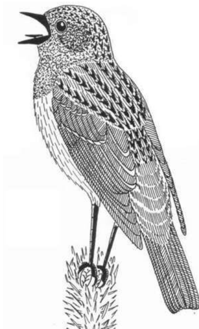
Oriešok Hnedáčik - oriešok hnedý