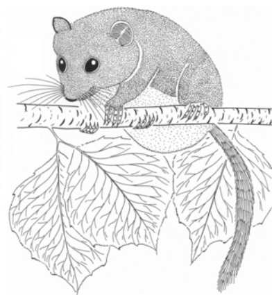
Plch Plcháč - plch lieskový/plšík

- Koho iného som tu mohol nájsť, ak nie teba, orešnica Alica? - riekol plch Plcháč. - Vždy keď začne u prababičky Prírody jeseň, nájdem ťa len a len tu. - A ty tiež nie si nikde inde len tu, - odvetila orešnica Alica. - Ale vedže sa na mňa za to nehnevaj, - vravel plch. - Ja som rád, že si tu nechrumkám sám. Už dlhšie som sa ťa chcel aj tak na niečo opýtať, ak mi dovoľíš. - A čo ti leží na srdci? - zaujímalo orešnicu Alicu. - Vôbec neviem, ako si vlastne prišla k takým krásnym šatám so zlatými perličkami, - čudoval sa nahlas plch Plcháč. - Bol by som rád, keby si mi to prezradila, ak to nie je nejaké tajomstvo.