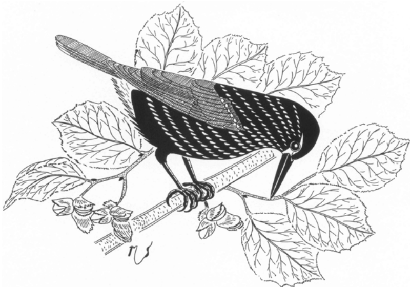
Orešnica Alica - orešnica perlavá

Keď si raz tak lúskala lieskovce na lieske Agnese, oslovil ju plch Plcháč, ktorý si tiež prišiel pomaškrtiť na lieskových jadierkach.